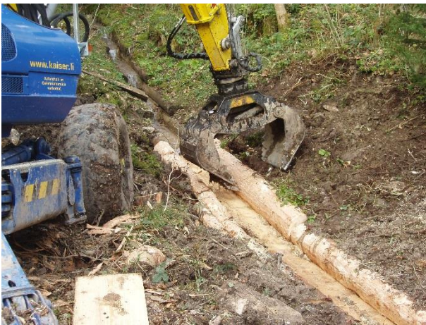
Abbildung 4: Positionierung der seitlichen Rundhölzer