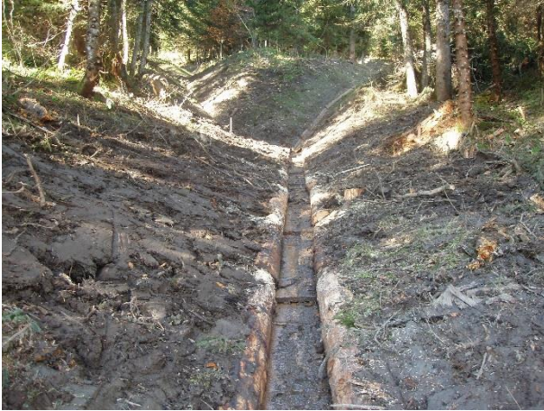
Abbildung 8: Übergang V-Kännel zu Rundholz-Rechteckkännel