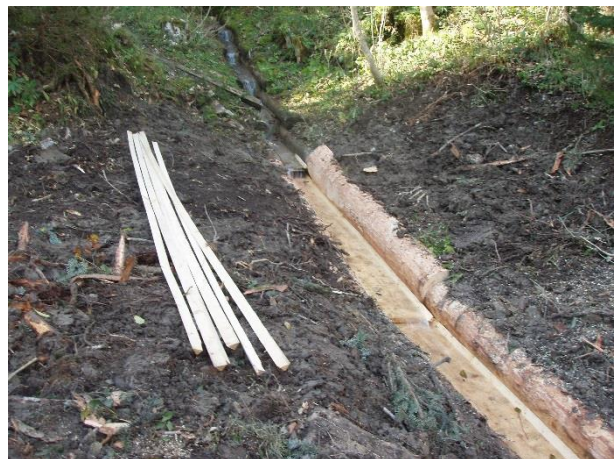
Abbildung 7: Einbau der Dreiecksleisten