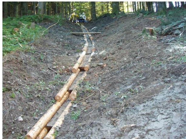
Abbildung 5: Wechsel vom stufigen zum flachen Einbau