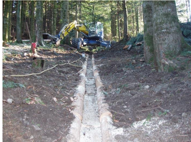
Abbildung 3: Laufende Einbauarbeiten: