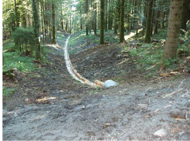
Abbildung 9: Fertig erstellter Hauptkännel inkl. Ansaat