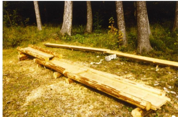
Rundholz-Rechteck-Kännel Typ 40/25