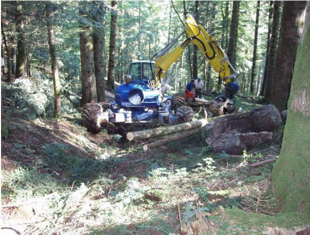
Abbildung 2: Bereitstellen des Rundholzes