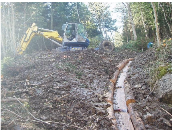
Abbildung 6: Zwischenreinigung der Känel